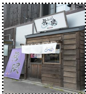
らあめん無限・花園町 24-21

函館一顔の怖いラーメン店主さん：「わかりました」、「やりましょう、つてかやらせてください」、「仲間にも話してみます（※後日、市内の人気ラーメン店3店+老舗製麺会社で合同実施するとの連絡あり！）」、「冷たいスープで塩味？それでいきましょう！」（※「はこだて冷やし塩ラーメン（ジュレタイプ）」は、フルマラソン35.8kmの地点第10エイドステーション＝緑の島で提供いたします ※数量限定）。