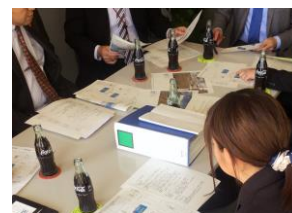
●コカ・コーラ社との打合せ状況：なんと瓶コーラが出てきていつもかなり嬉しくなるのであります

これは「コカ・コーラ」の商品説明文ですが、ちょっとシビれましたね。まさしくマラソンにぴったりな飲み物です。