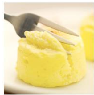
●ペイストリースナッフルス チーズオムレット

そうです、あの店のあれだけは外せませんよね。わかってますよ皆まで言わないでください。ということで、全国の北海道物産展などでも飛ぶように売れ続けるあのフワフワでトロトロの銘菓も、函館マラソンのフードとしてご提供いただけることになりました。本当にありがとうございます！