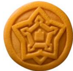
●千秋庵総本家 カステラ饅頭 函館散歩

超老舗和菓子社長：「え？なんだっけ？あ、例のあれね、聞いてますよ。」、「あのね、どら焼きだと大きいからカットしなきゃなんないでしょ。それ面倒ですね」、「だから1個ずつパックしてるお菓子あるから」、「それ、今のウチのイチおしなんだけどね、どう？」。