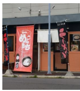
らあめんめんきち・日吉町 3-44-13