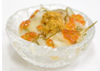
●函館朝市協同組合連合会 漁り火がごめ丼（※大きく見えますが、ひとロサイズです念のため）。なお朝市さんでは函館マラソンのゼッケン提示で各店オリジナルのサービス特典ありとのこと…嬉しいですね。詳しくはポップを目印に加盟店へ。

いやー涙がでますね（※「漁り火がごめ丼」はフルマラソン35.8km地点の第10エイドステーション＝緑の島で提供いたします ※数量限定）。