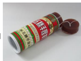
●五勝手屋本舗 五勝手屋ミニ丸缶羊かん

事務局：「え？」、「ちょっと意味がわからないんですけど」（※パニック状態）、「1本で206円でしたっけ？4千個だと80万円超えますよ！！」