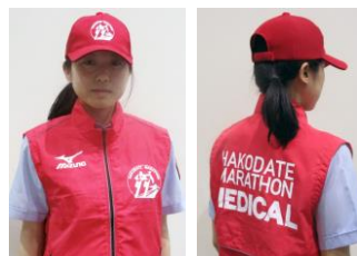
●メディカルスタッフ着用ベスト （※また随分と美しい方ですね…）

また、当日のコース上での医療・救護の強化策として、8箇所の救護所とゴール地点付近に収容救護所を新設するほか、メディカルバイク隊の強化（10隊を17隊に）、AEDを28箇所、民間救急車7台を新規配置いたします。