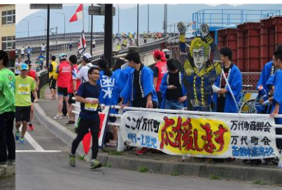
チーム「万代町商興会と水産高校」