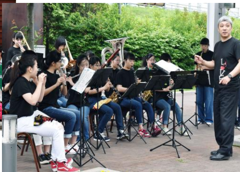
函館白百合学園中学高等学校吹奏楽団 ※バス移動のうえ2か所で応援していただきました！ (だから写真も少しだけ大きく…)