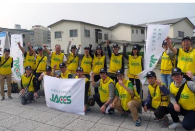
ジャックスエイド