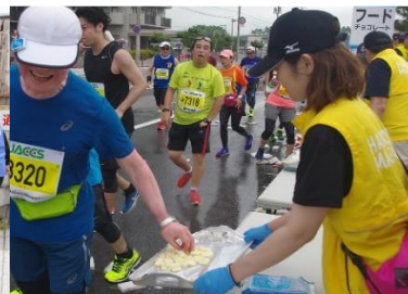
函館北ロータリークラブエイド