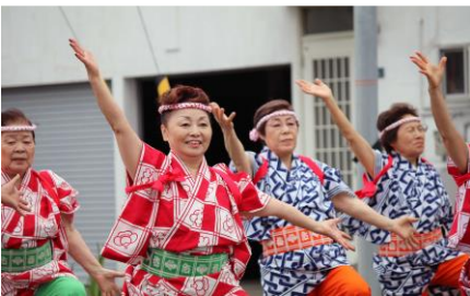
梅后流かっぽれ梅房会