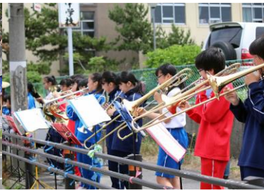
函館市立宇賀の浦中学校吹奏楽部