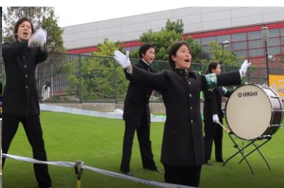
北海道大学水産学部第四十六代応援団