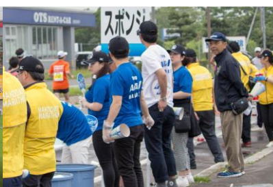
函館空港ビルディングエイド