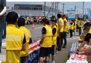
函館山ロープウェイエイド