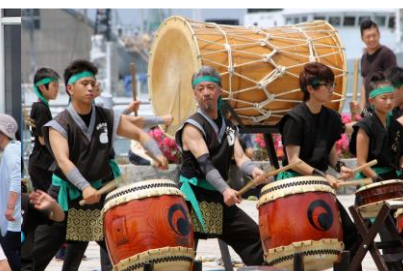
郷土芸能 函館巴太鼓振興会