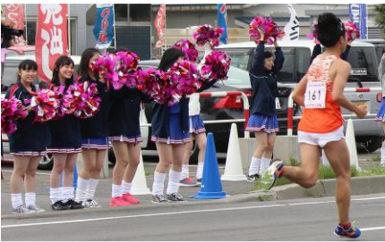
市立函館高校チアリーディング局