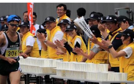
大和ハウス工業エイド