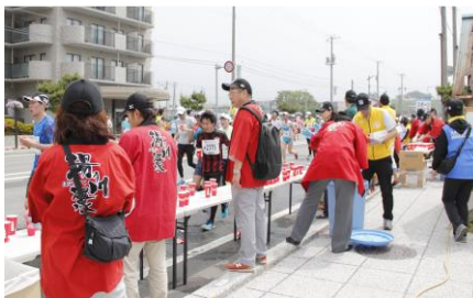
湯の川温泉旅館協同組合