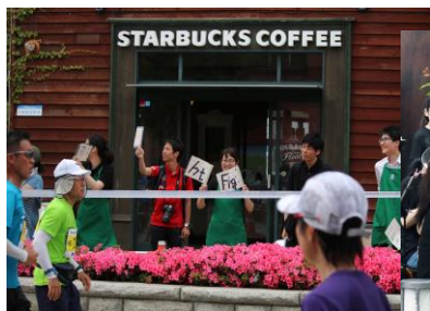
スターバックス函館ベイサイド店