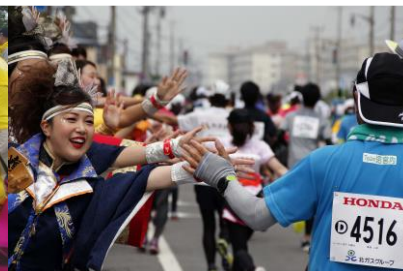
YOSAKOI ソーラン祭り 南北海道支部