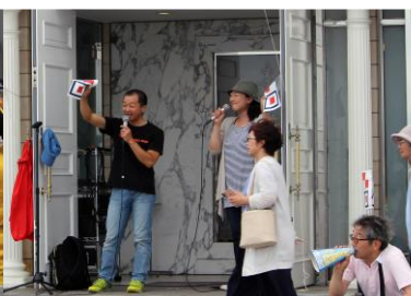
函館大学バイエリア・サテライト